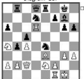
Stelling na: 18... Nxe4