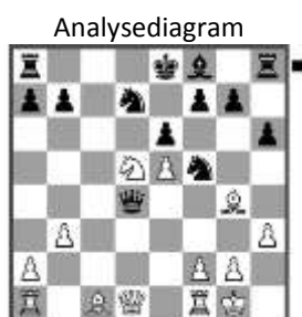
Stelling na: 14. Nxd5

13... Qxd4 14. Nxd5 (zie analysediagram)