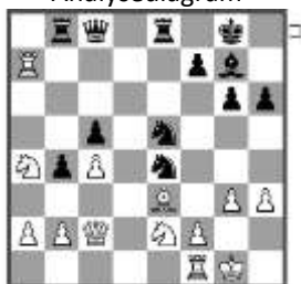
Stelling na: 20... Ne5