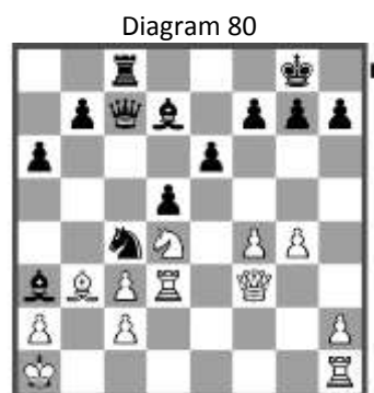
Stelling na: 20. Ka1