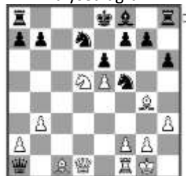
Stelling na: 14... Qxa1

B1.1) 17... Qd6 18. Bxf5 Qxd3 19. Bxd3 Bd6 20. Rd1 Ke7 21. Bb5 Nf6 22. Nc7 en het paard is ontsnapt. Wit zal een extra pion meesnaaien vanwege 22... Bxc7 23. Ba3+