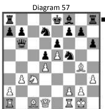
Stelling na: 13. Bg4

10... cxd5 11. h3 Bxf3 12. Bxf3 Qb6 13. Bg4!?