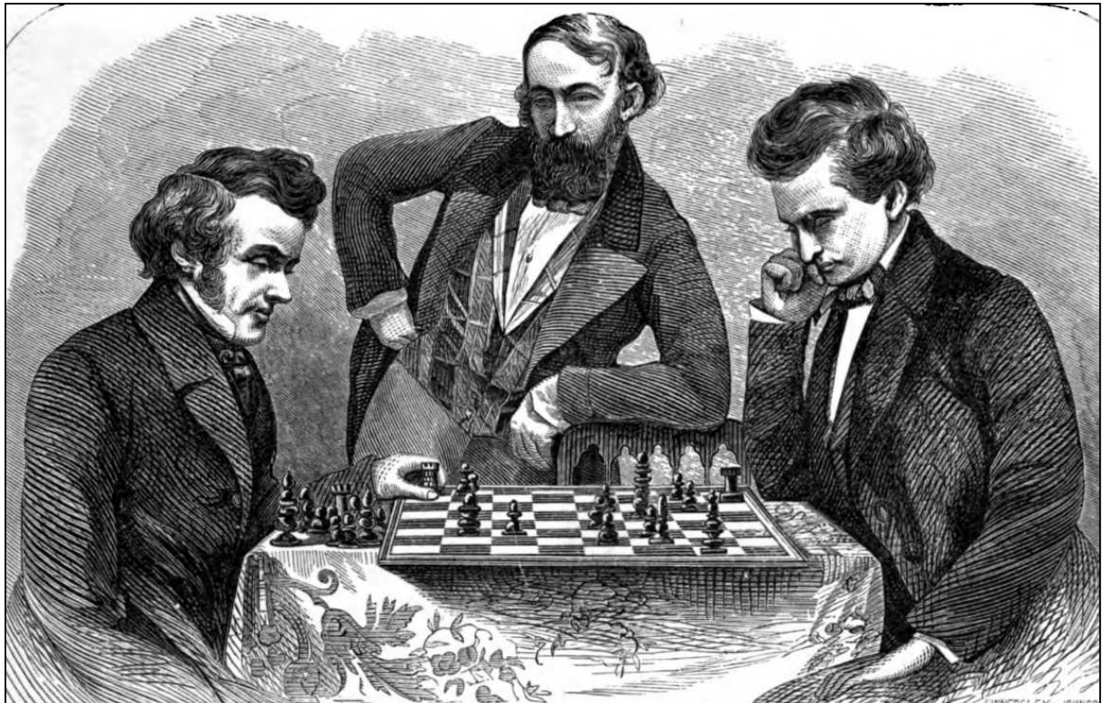
Charles Henry Stanley (links) und John Turner während ihres Wettkampfes in Washington 1850. Stehend Johann Jakob Löwenthal.

Nach dem Turnier spielte Stanley noch eine Reihe von Partien gegen Morphy und musste bewundernd die Überlegenheit des genialen Jungmeisters anerkennen. Lediglich in einer einzigen Partie gelang es ihm, Morphy zu überspielen.